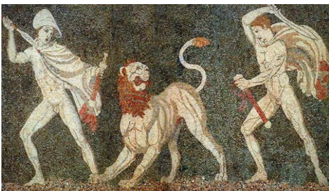
Ψηφιδωτό από την Πέλλα