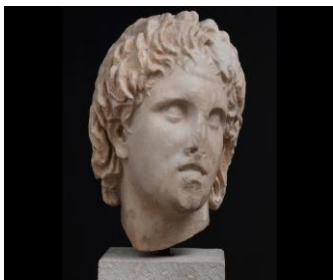
Προτομή Μεγάλου Αλεξάνδρου