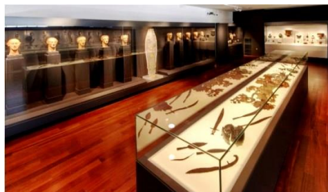
Αρχαιολογικό Μουσείο Πέλλας